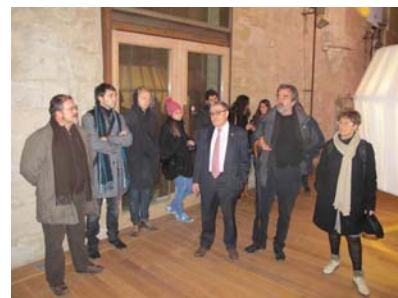
Foto 2. La salutació s'ha fet al Castell del Rei, al Turó de la Seu Vella