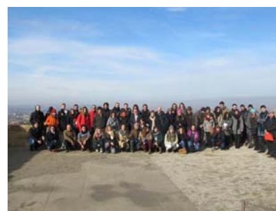
Foto 1. Àngel Ros ha saludat els alumnes de la UPC que visiten Lleida per un taller urbanístic de paisatges culturals

URBANISME, MOBILITAT, VIA PÚBLICA, CONCESSIONS, OFICINA D'ATENCIÓ CIUTADANA